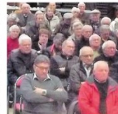
Les adhérents à l'assemblée générale de l'Union nationale des combattants.