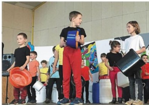
Les petits artistes ont utilisé des bidons et autres objets de récupération pour leur spectacle : les bidons de la Noue-Vallée.