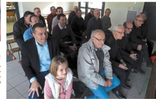
Assemblée générale de l'ACG, samedi matin, au club-house du foot, devant une trentaine de bénévoles.