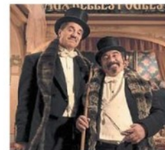
« Edmond », film d'Alexis Michalk.

Montaigu - Caméra 5, av. Villebois-Mareuil Edmond : 20 h 30. Ventil : 20 h 30.